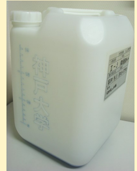
神戸大学専用の廃液タンク